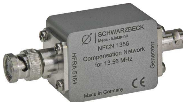
Abb. 1. Kompensationsnetzwerk NFCN 1356. Fig. 1. The NFCN 1356 compensation network.