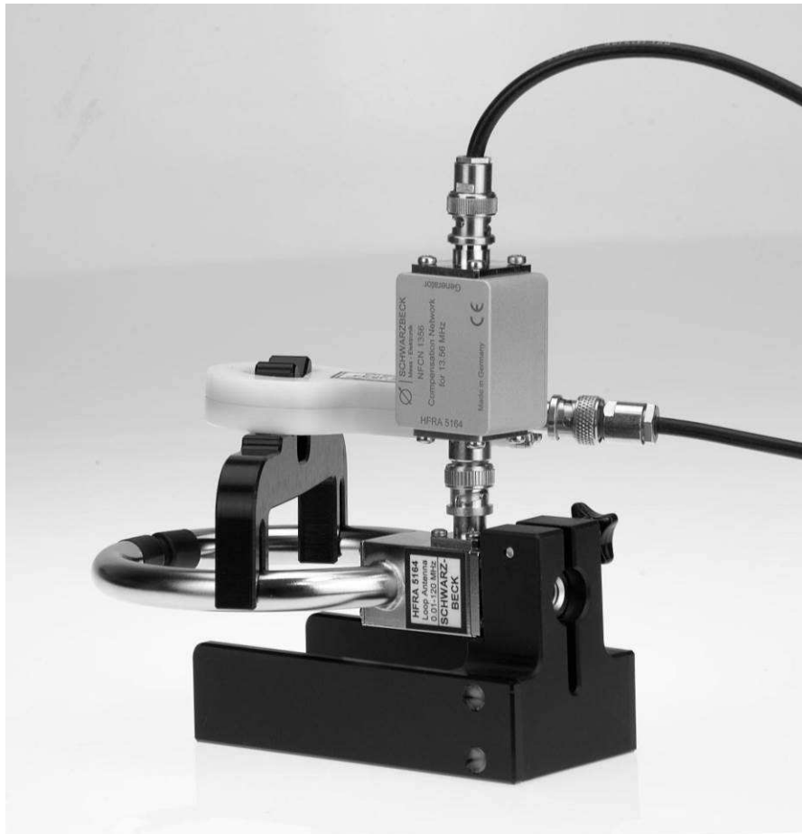
Abb. 3. Aufbau zur Einstellung einer gewünschten H-Feldstärke: das NFCN 1356 ist mit der HFRA 5164 direkt verbunden. Der Loopholder 5164-39 hält die Monitorspule FESP 5134-1 in 50 mm Abstand zur felderzeugenden Spule HFRA 5164.

Fig. 3. Setup for setting a certain magnetic field strength: The NFCN 1356 is connected directly to the HFRA 5164. The FESP 5134-1 monitoring loop is installed at the distance of 50 mm from the HFRA 5164 using the Loopholder 5164-39.