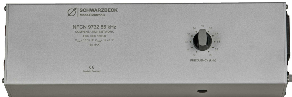
Abb. 1 NFCN 9732 85 kHz von oben mit Frequenzwahlschalter Fig.1 NFCN 9732 85 kHz top view, frequency selection switch