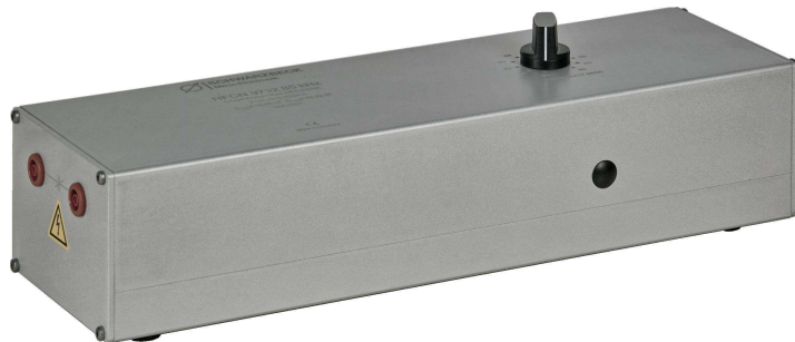
Abb. 2 Blick auf die Anschlüsse des Kondensators Fig. 2 View of the connectors for the capacitor

A capacitance of 15.7 nF is hard wired to the 4 mm safety laboratory connectors. The variable capacitor part gets added to the total capacitance value by using relays.