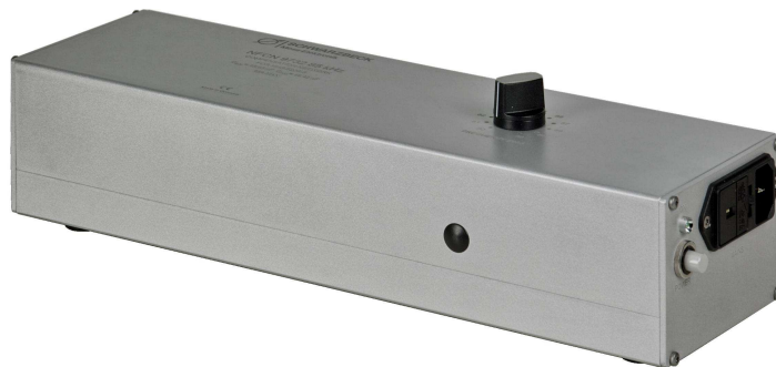
Abb. 3 Netzschalter und Netzanschlussverbinder Fig. 3 Power switch and IEC connector