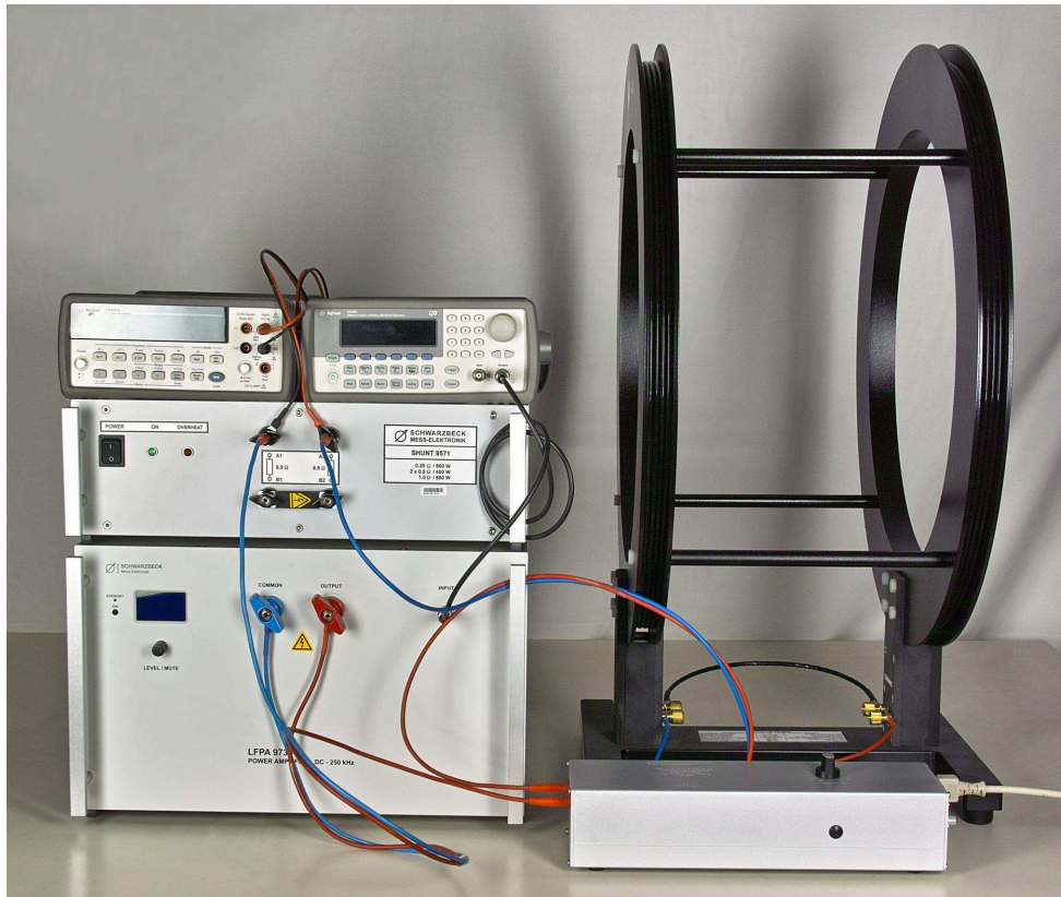
Abb. 5. Beispiel: Typischer Aufbau des Testsystems IMMSYS 85 kHz, bestehend aus Funktionsgenerator, Leistungsverstärker LFPA 9733, Kompensationsnetzwerk NFCN 9732 85 kHz, Helmholtzspule HHS 5206-8, SHUNT 9571 und Voltmeter.